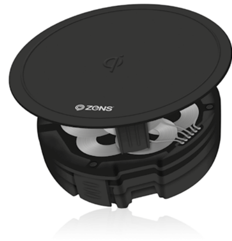
ZENS PUK ZESCO2N/00